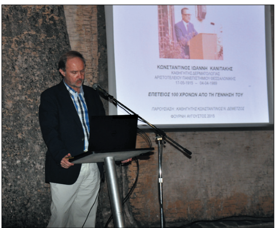
Ο Αντιπρόεδρος στην ομιλία του για τα 100 χρόνια από τη γέννηση του Καθ. Κων. Κανιτάκη