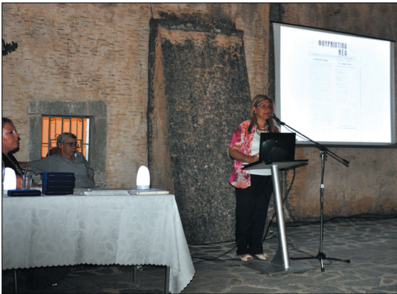
Η Πρόεδρος στην ομιλία της για τα 40 χρόνια του Συλλόγου