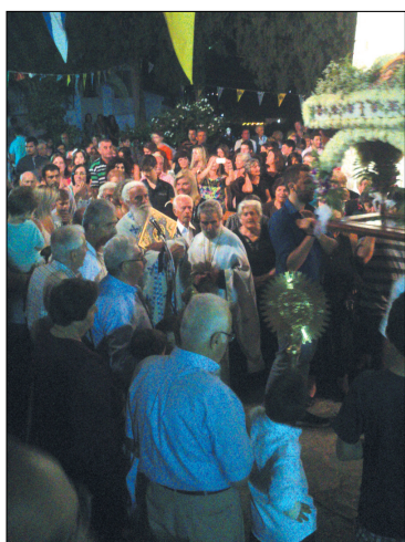
Βραδιά επιταφίου στο Πάνω Χωριό

Αποκορύφωμα των καλοκαιρινών πανηγυριών αποτελεί ο 15 Αυγούστος, εορτή της Κοιμήσεως της Θεοτόκου. Η γιορτή της Παναγίας γιορτάστηκε και φέτος στη Φουρνή με τη συμμετοχή πλήθους κόσμου. Ο εσπερινός και η ακολουθία του Επιταφίου με τα εγκώμια τελέστηκαν στην εκκλησία του Επάνω Χωριού. Ο κόσμος που προσήλθε στις παραπάνω τελετές ήταν πάρα πολύς με αποτέλεσμα την πλήρω-