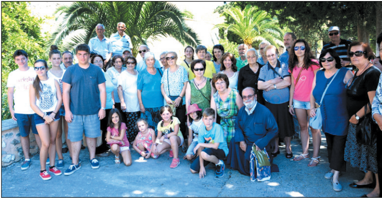
Οι εκδρομείς στο προαύλιο της Μονής Επανωσήφης