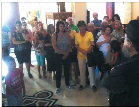
Στην εκκλησία της Μονής Αγκαράθου

Στη συνέχεια κατευθυνθήκαμε προς τις Αρχάνες, μια πρότυπη κωμόπολη. Τα περισσότερα σπίτια είναι αναπαλαιωμένα και δεν υπάρχουν αντιαισθητικοί στυλίοι και καλώδια για το ρεύμα και το τηλέφωνο. Όλες αυτές οι παροχές έχουν γίνει υπόγειες. Προτού καθίσουμε στο κέντρο για το γεύμα μας, επισκεφτήκαμε τον ιερό ναό της Παναγίας, πραγματική πινακοθήκη όπου μας