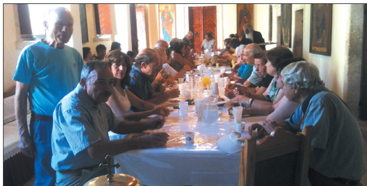
Κέρασμα στη Μονή Αγκαράθου